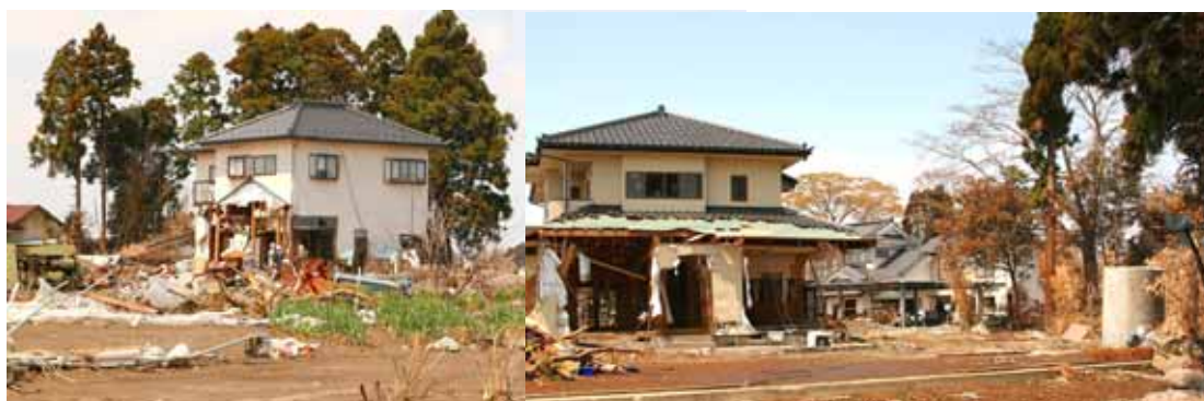
海岸から約1200m離れた仙台市宮城野区新浜浦通の屋敷林を備えた住宅

仙台平野では居久根に代表される屋敷林が有名である。今回の被災地では、典型的な居久根といえるような樹林は少ないが、いくつかの例を観察できた。