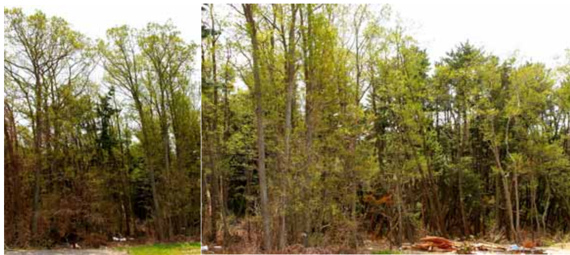
海岸クロマツ林の後背部に発達したハンノキ林。石巻市渡波地区。

地形的には、砂丘後背地に低湿地や池沼、潟ラグーンが発達する。相馬市の松川浦芹谷地、亘理町の鳥の海、名取市の広浦、さらには岩沼市から仙台市に及ぶ貞山堀、東松山市の東名運河、北上運河もその名残を示すものである。熱帯地方ではこの場所にマングローブ林が形成される例が多い。ここ仙台平野地域では農業基盤整備や宅地、工業立地の開発が進み、当初の地形や自然植生の面影を見ることは難しい。今回の調査で、砂丘後背地の低湿地にヨシなどの湿性草地が見られるほか、湿地林の小林分、ハンノキ林が沿岸部にも観察された。岩手県内でも同様の樹林が認められており、砂丘後背湿地の潜在自然植生を示す樹林として重要である。