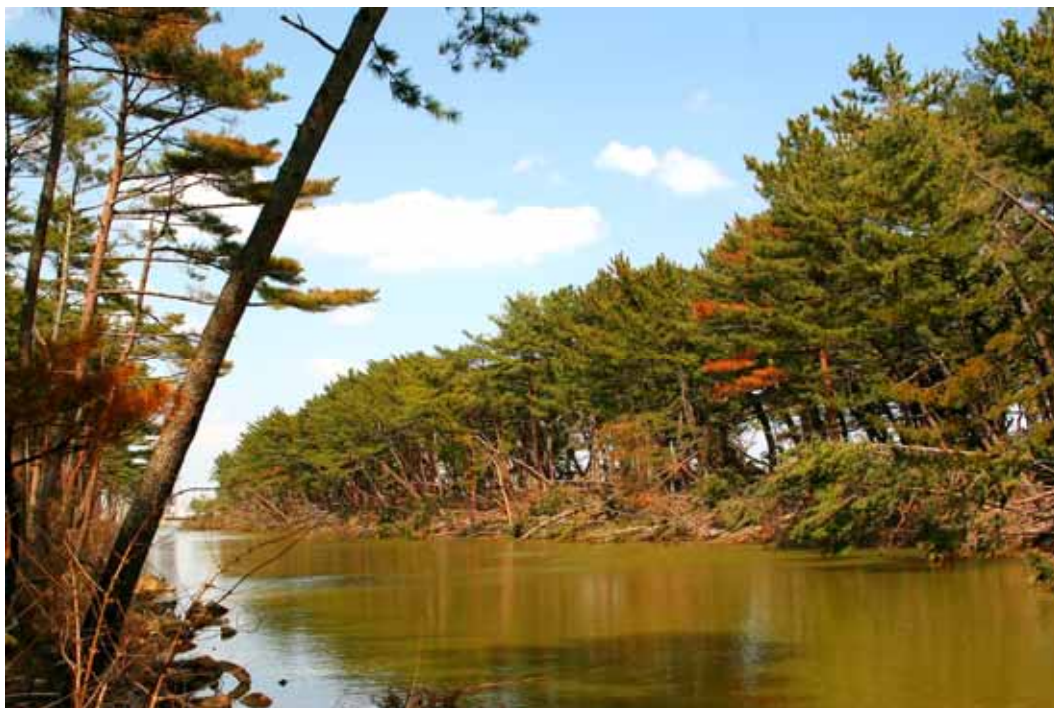
仙台市宮城野区にある貞山運河沿いにある被害が少し軽微であったクロマツ林。林内はクロマツとアカマツの混交林で他の樹木類をほとんど混生していない。

海岸砂丘に見られる海岸林のほとんどは人工的に植栽された樹林であり、主に砂防・飛砂防止用にクロマツ、アカマツが植林されている。それではこの地方での本来の自然植生は、どのような樹林であるのだろうか。潜在自然植生の概念を取り入れながら観察を行った。