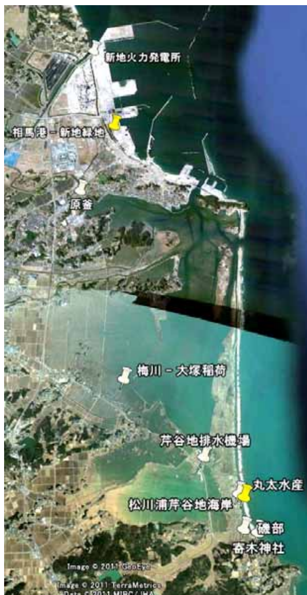
基図は Google Earth 画像を利用