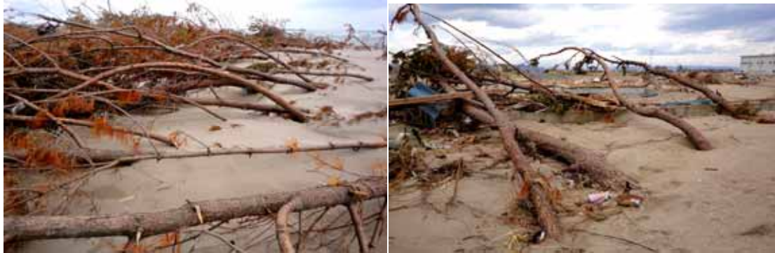
鳥の海の河口部砂洲にあった若いクロマツ人工林、根元から倒伏している。