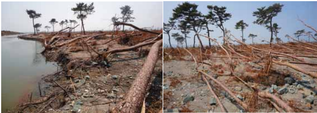
防潮堤の背後では、大規模な落掘が発生、幅 40～50m にも及ぶ水路が形成されている。 落掘とその背後のマツ林。福島県相馬市松川浦芹谷地海岸