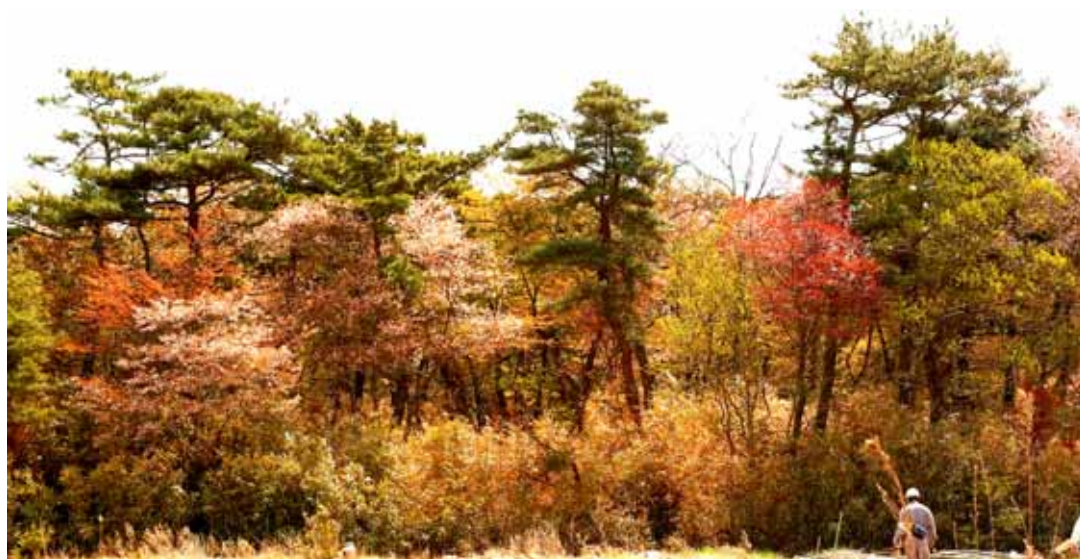
亘理町道下、松ヶ崎山の海岸林。植栽されたクロマツ林内に自然に進入した多くの広葉樹が混生している。多くがヤマザクラで、コナラ、ミズキなども散在する。林内には常緑性の広葉樹タブノキ、シロダモ、ヒサカキなども見られ、より多様で多層構造の海岸林といえる。