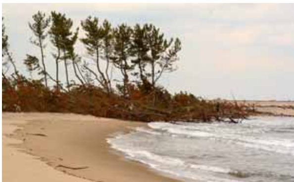
地盤沈下を伴い、マツ林が波打ち際に接している。今後の生存は不可と思われる。 宮城県亶理郡亶理町、鳥の海大畑浜