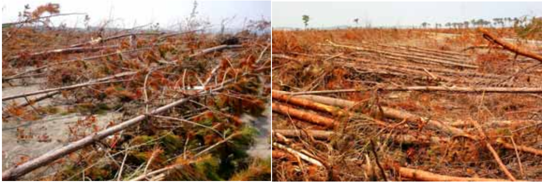
樹齢 10 年から 20 年程度の若いマツ林は、流木とならず、ほとんどその場に倒伏している。