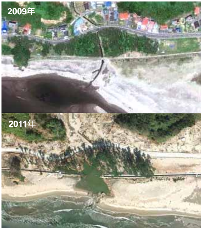
Fig. 19 津波前後の石巻市白浜海岸のクロマツ海岸林。地盤の弱い小河川沿いに砂浜が集中的に浸食され、堤防も破堤している