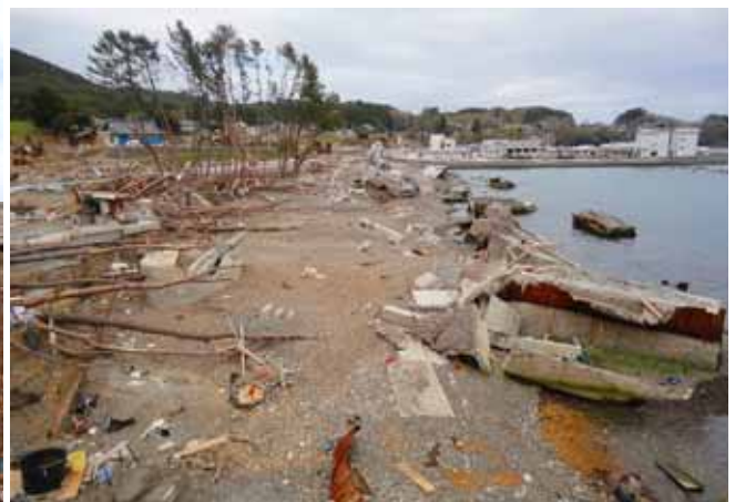
Fig. 23 防潮堤を破壊し、海岸松林もほとんど破壊 (岩手県大船渡市小友浦谷地)