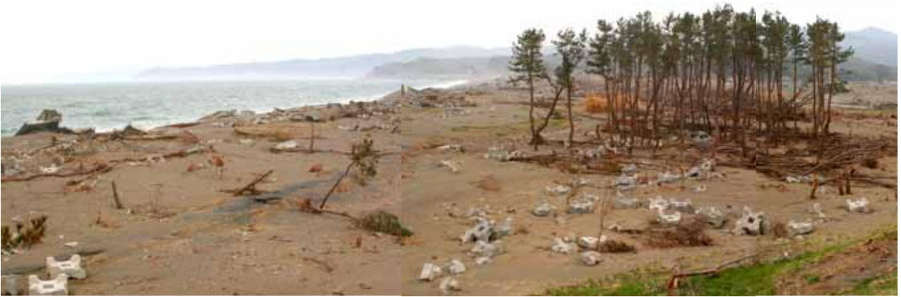
Fig. 8 防潮堤が破壊され、その破片や波消しブロックが松林を直撃している（岩手県九戸郡野田村）