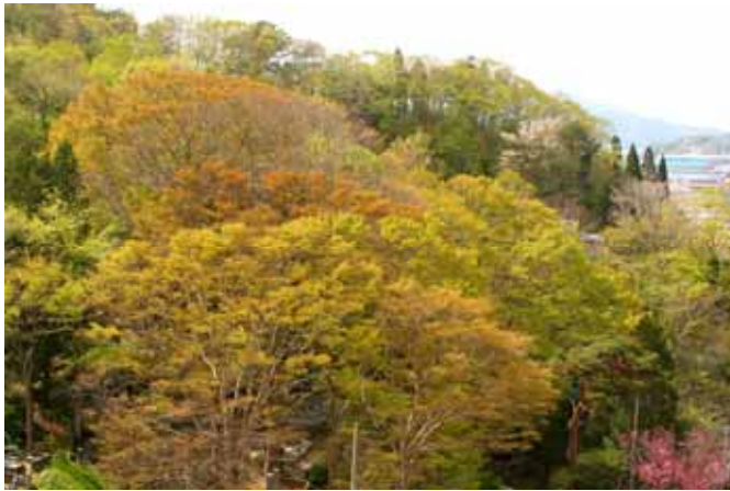
Fig. 3 宮古市山根地区の丘陵部に発達したケヤキ林