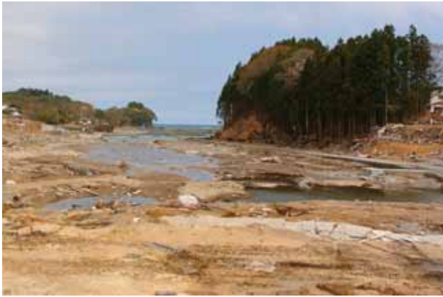
Fig. 31 大船渡市、小友 - 広田谷地地区の状況