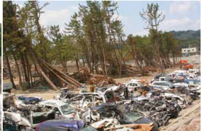
Fig. 13 堤防が破堤、内側のクロマツ海岸林も破壊（岩手県大船渡市三陸町泊漁港）