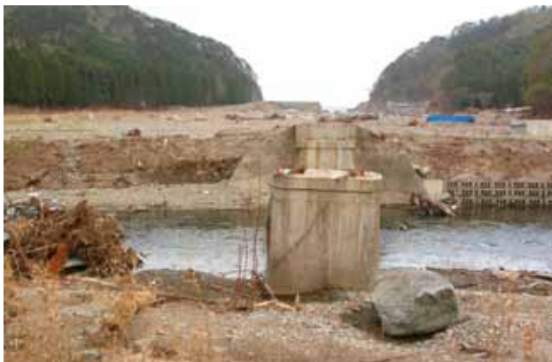
Fig. 32 狭い入り江を襲った津波、(宮古市摂待)