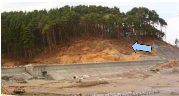
Fig. 40 堤防脇の岸壁に津波が駆け上がり、植生を破壊し ながら、防潮堤の堤内に流入（九戸郡野田村十府 ヶ浦 下安家）