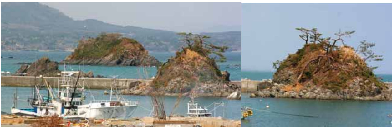
Fig. 35 湾内にある岩礁島も津波で植生が大きく破壊 (宮城県気仙沼市蔵内)

津波は海岸低地に止まらず、海岸に迫るリアス式海岸の山地斜面を津波が駆け上がり、30mを越える高さにまで達している。一部では斜面崩壊を生じ、植生を破壊している。また大量の海水が冠水することで、植生に物理的および生理的影響を与えている。