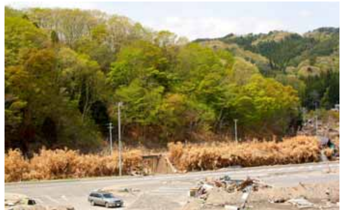
Fig. 45 堤防を越えた津波は鉄道沿線のネザサ類を枯らしたが、丘陵部の雑木林は芽吹いている。8月の調査ではネササは再生していた(岩手県宮古市高浜地区)