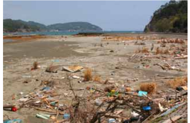
Fig. 26 湾入部を襲った津波、平地部分にはほとんど何も残っていない（岩手県釜石市鶴住居）