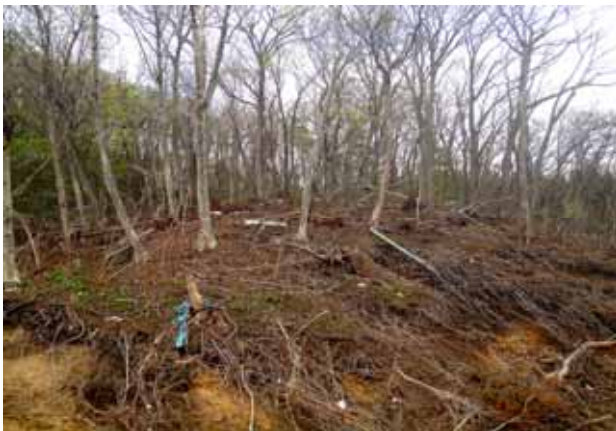
Fig. 46 津波が丘陵部ミズナラ林内に入り込み、春5月草木の芽生えが制限されている(九戸郡野田村安家地区)