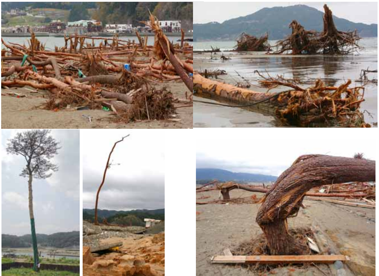
Fig. 20 砂浜の浸食と地盤沈下でアカマツ、クロマツの海岸林のほとんどが破壊された陸前高田市海岸とその破断例、立ったまま残ったマツは二本のみ（岩手県陸前高田市）