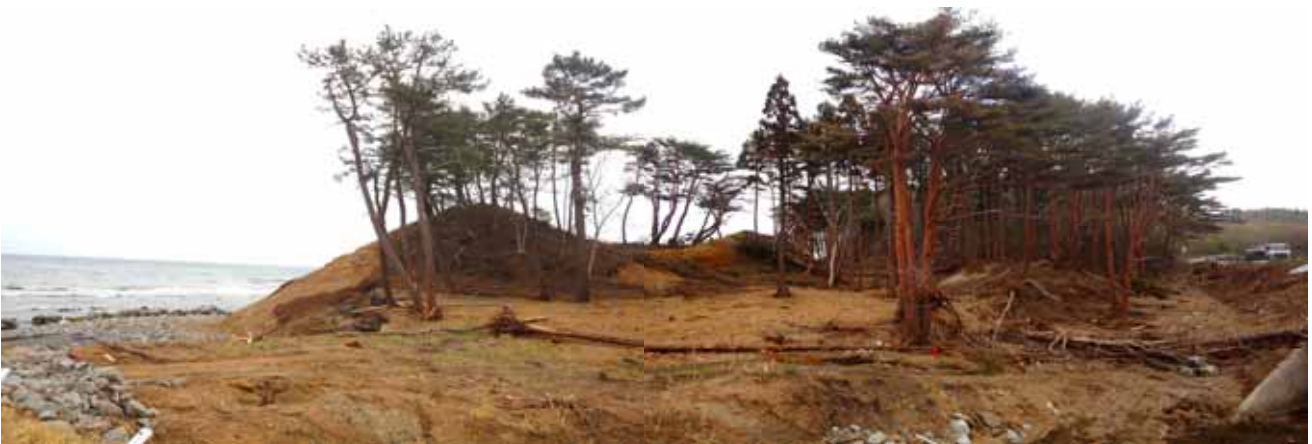
Fig. 10 津波が海岸丘陵部に乗り上げ、海岸松林のクロマツ、アカマツ林を破壊（岩手県九戸郡野田村十府ヶ浦 下安家）