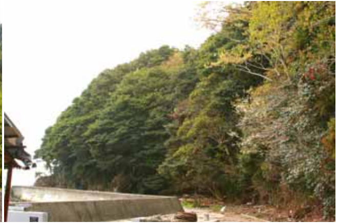
Fig. 2 南三陸町北ノ又漁港の常緑広葉樹林、ヤブツバキ、シロダモを含むイノデ・タブノキ群集の樹林