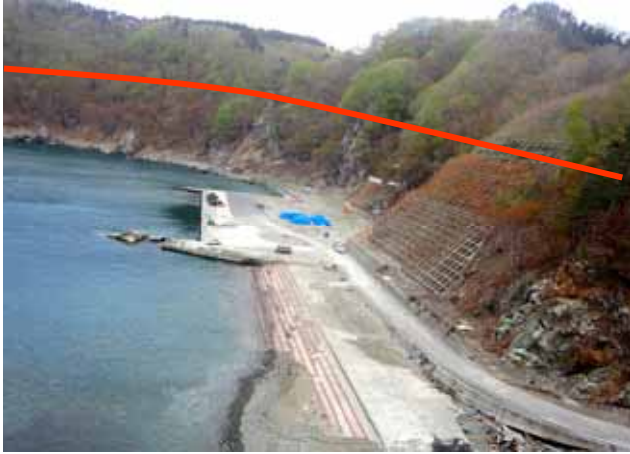
Fig. 36 陸域斜面へ約 20 - 30m津波がのりあげる 植物の葉が茶変している（下閉伊郡岩泉町 茂師漁港）