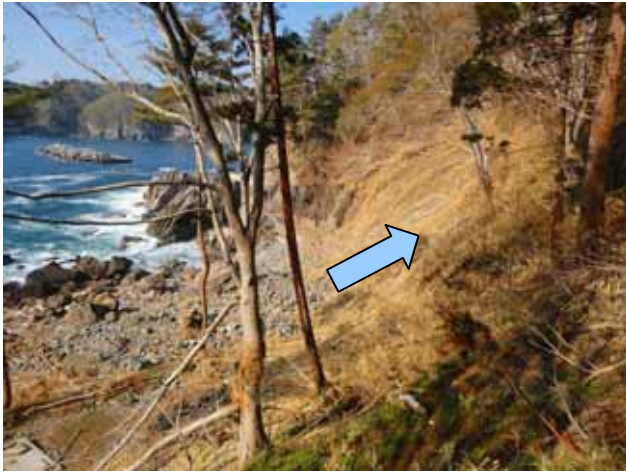
Fig. 38 リラス式海岸の岸壁に津波が駆け上がり 植生を破壊、竹類が茶変している （岩手県宮古市田老町三王岩）