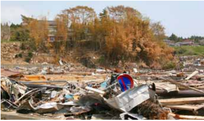
Fig. 42 海水の冠水で茶変したマダケ (岩手県南三陸町歌津)