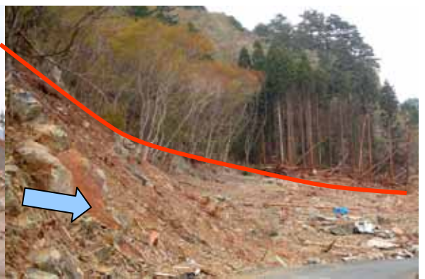
Fig. 41 防潮堤の側面を乗り越えた津波 （宮古市田老町摂待）