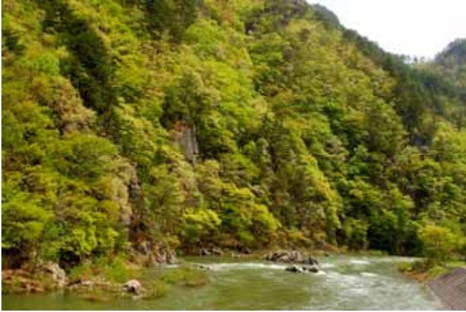
Fig. 1 宮古市閉伊川の渓谷林、尾根から順にアカマツ、ミズナラ、ケヤキ林が発達する