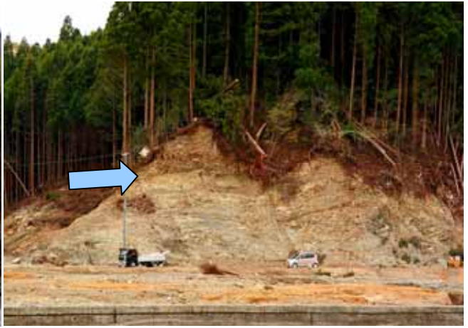
Fig. 37 スギ林のある斜面を津波が駆け上がり、 浸食した様子（宮城県南三陸町戸倉）