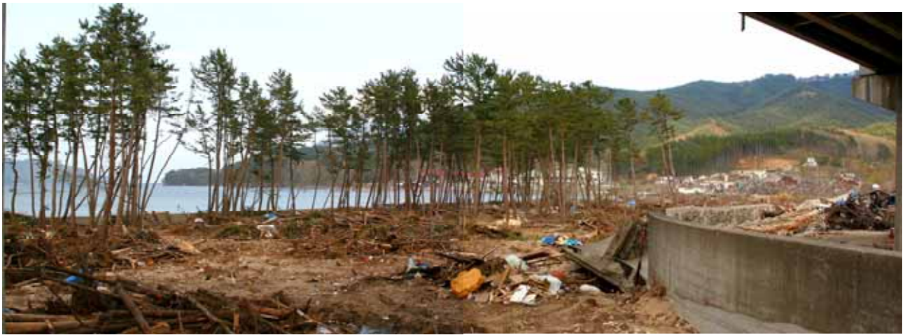
Fig. 9 津波が低い堤防を簡単に乗り越え、内側の海岸松林と集落を直撃、破壊（岩手県下閉伊郡山田町船越）