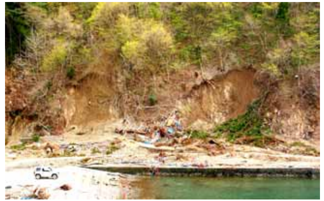
Fig. 43 津波の駆け上がりで崩壊した斜面 (岩手県釜石市両石漁港)