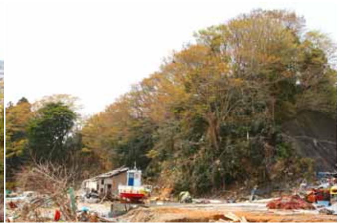
Fig. 4 南三陸町稲藤漁港に見られるケヤキ斜面林 ケヤキの芽吹きが始まったところ、林床にはヤブツバキなどの樹緑樹が目立っている