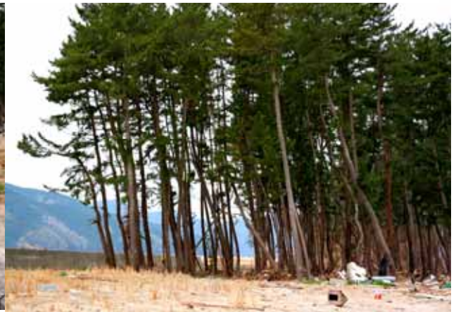
Fig. 12 北上川(追波川)を遡上した津波が堤防を越えているが大きな破壊に至らなかったクロマツ海岸林、海側のクロマツは潮焼している。（宮城県石巻市白浜）