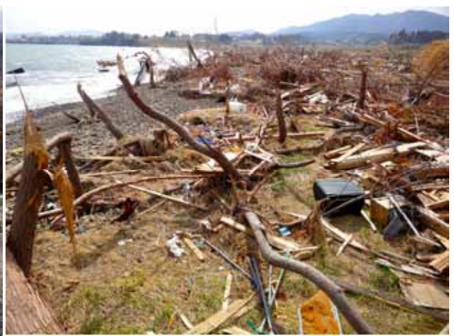
Fig. 24 比較的若いクロマツ海岸林のほとんどが破壊され、地盤沈下も加わり砂浜が消失、汀線が海岸林に接している(宮城県気仙沼市大谷海岸)