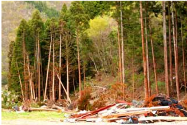
Fig. 50 津波の直撃を受けたスギ林、樹幹が激しく傷んでいる。宮城県石巻市白浜