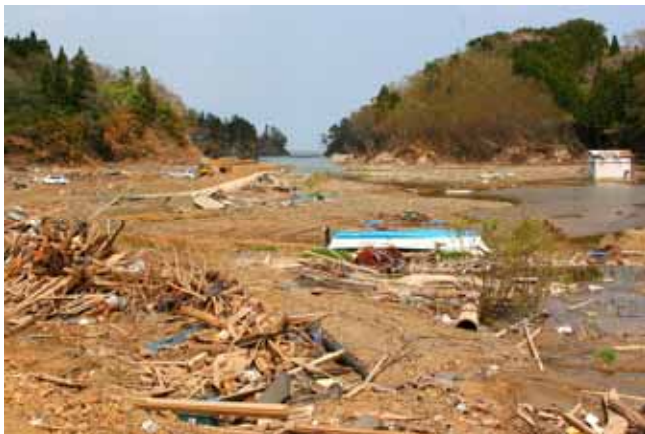
Fig. 27 狭い入り江を襲った津波（宮城県南三陸町陸前港町）