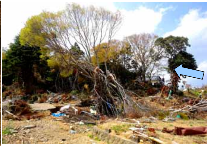
Fig. 39 津波の直撃に辛うじて残ったケヤキ （宮城県気仙沼市蔵内）