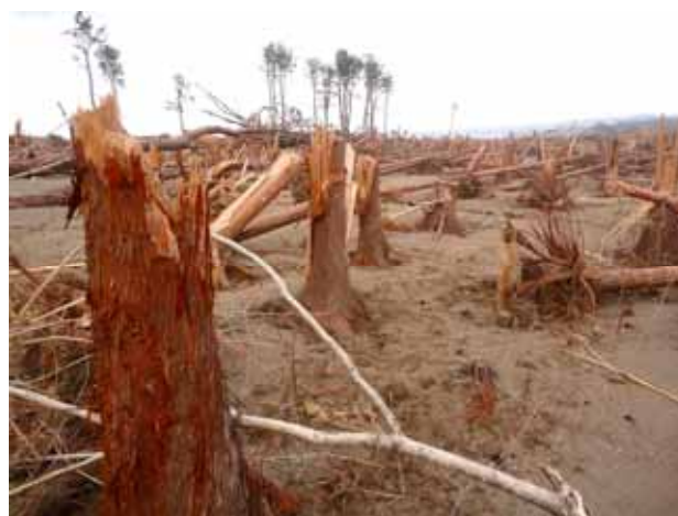
Fig. 7 破断した松と杉(手前) (岩手県九戸郡野田村)