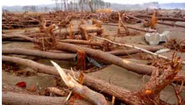
Fig. 6 倒伏と破断が混在する野田海岸の海岸松林 (岩手県九戸郡野田村)

宮城、岩手の海岸域に造成された海岸林は主にクロマツ、アカマツの松林である。海岸域が狭いこともあり、ここではあまり大規模な海岸林は見られない。佐々木・田中 2011 に記載したとおり、海岸林の破壊のパターンには倒伏、破断、流出の三パターンが認められ、宮城、岩手の海岸域では、とくに破断のケースが目立っている。リアス式海岸で比較的狭い海岸に、津波が集中して押し寄せたことと、岩手県久慈市から宮城県女川では 12 - 18m を越える津波浸水深を記録している（東北地方太平洋沖地震津波合同調査グループ）ことがその要因である。また、一方で海岸に敷設された防潮堤や水門の多くが破壊され、多くの壊れたコンクリート破片や波消しブロックなどが海岸林を直撃し、松林をなぎ倒している例も多数観察された。以下には主な海岸林破壊の状況を挙げた。