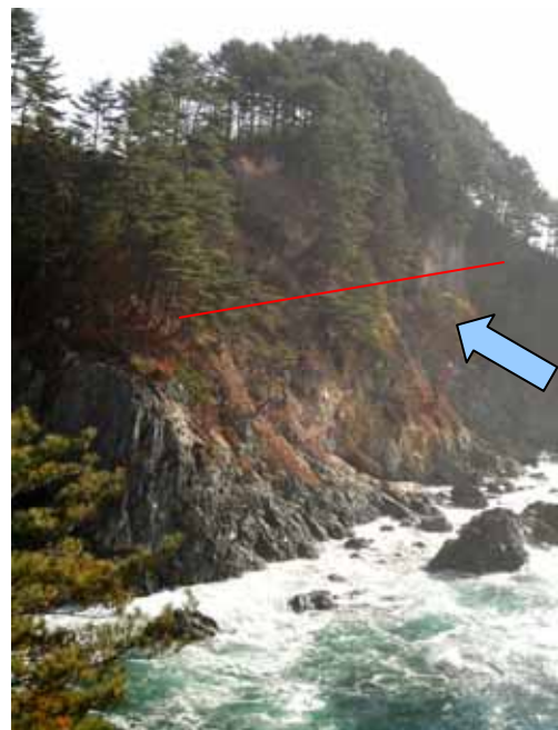
Fig. 34 津波のかけあがり 岩手県宮古市田老町山王岩