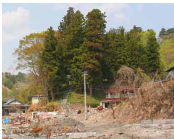
Fig. 54 神社林とともに残存した宮古市高浜の神社 ここではケヤキとスギが優占する

今回の大災害を受けて、政府や関係研究機関らが、沿岸の防災、減災対策の一つとして、新たな海岸林の併用設置をも模索している。その議論の中で、これまでのようなクロマツ植栽のモノカルチャー的な樹林だけでなく、多種類混植の導入も検討されている。今後さらに海岸林の種類構成、群落構造、規模と配置、地形や地質、堤防との組み合わせ配置なども検討されねばならない。その意味でも神社林の再認識が必要である。