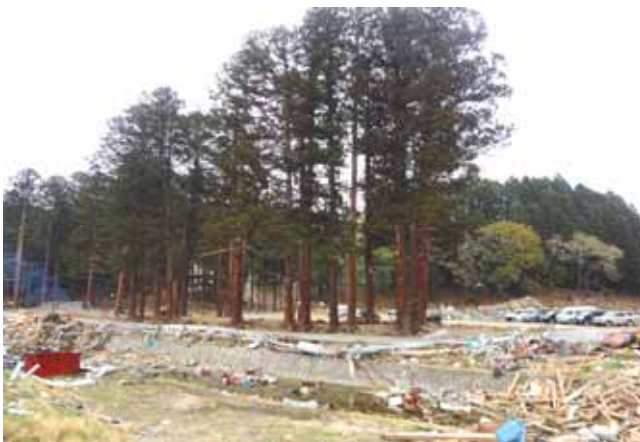
Fig. 51 河口から約1.1km内陸部平地にあるスギ林 海水の冠水に持ちこたえている (宮城県南三陸町竹川原地区)

津波は、リアス式海岸の狭い平地の多くを飲み込んでいる。数少ない安全な場所は高台であるが、その高台に至るアクセス、距離、道や階段の有無なども安全性にとって重要となる。今回の調査の中でも、集落の近くで、高台に位置した神社や寺院が多数見られ、しかもその多くは壊滅的な破壊を免れている。こうした神社、寺院の設置場所も、多かれ少なかれ意識的に高台に設けられていると思われる、今後の防災、緊急避難地として見直し、より活用されるべき場所の一つといえよう。