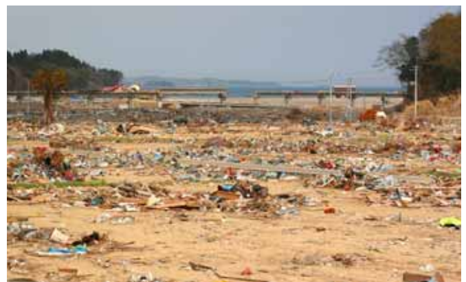
Fig. 30 入り江を襲った津波、防潮堤、道路、鉄道を破壊（宮城県気仙沼市小泉）