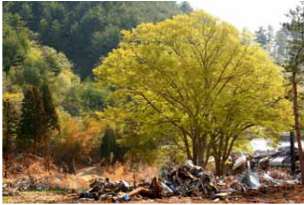
Fig. 48 海水の冠水にも関わらず盛んに芽吹いたケヤキ、後方の竹類は茶変している (岩手県宮古市女遊戸)