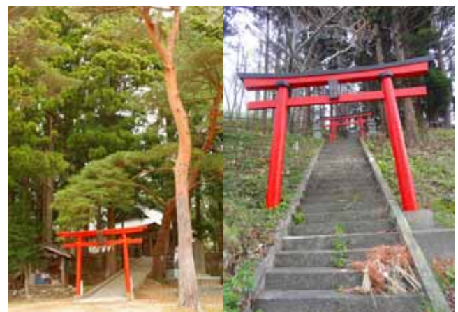
Fig. 52 高台に位置する多くの神社が津波被害を免れている 大船渡市細浦熊野神社(左)、岩泉町茂師豊川神社(右)