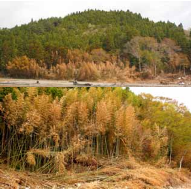
Fig. 44 海水の流入で著しく茶変したマダケ、宮古市女遊戸(上)と南三陸町戸倉(下)