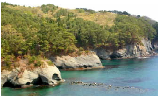
Fig. 5 海岸岩上に発達したコナラ林とクロマツ林 この場所も津波の直撃を受けている(宮古市蛸の浜)