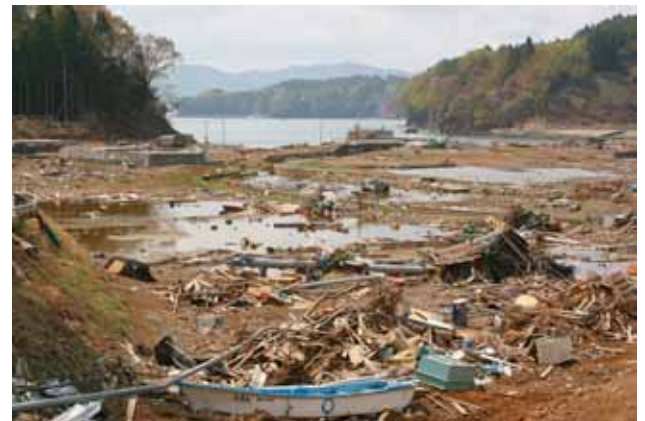
Fig. 28 狭い入り江を襲った津波、両側の丘陵樹林だけが残る（宮城県南三陸町西田 - 細浦）