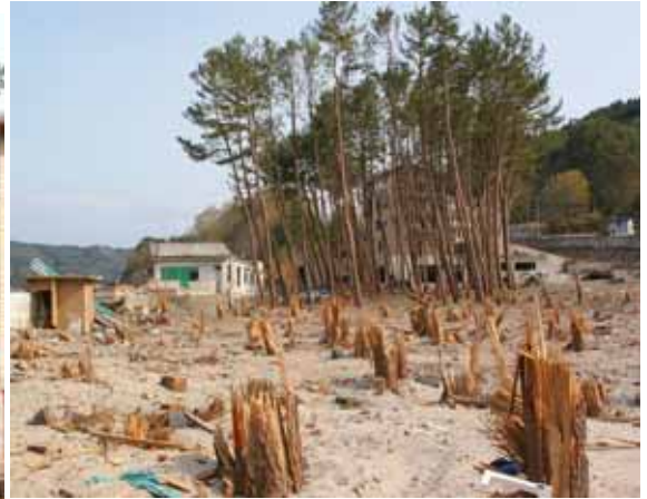
Fig. 11 堤防を乗り越えた津波で大半が破断したクロマツ海岸林（岩手県上閉伊郡大槌町浪板）