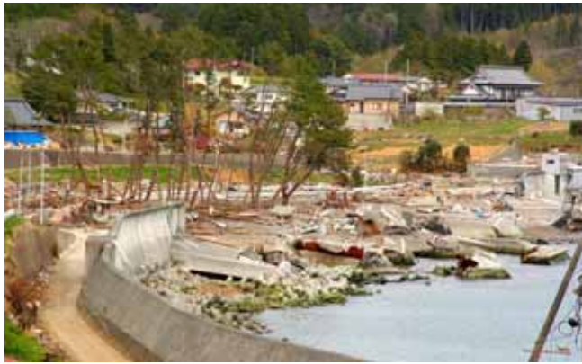
Fig. 25 津波の引き波で防潮堤が破壊、海岸松林も大きく損傷した（岩手県大船渡市碁石）