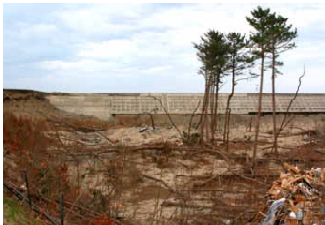
Fig. 22 防潮堤を津波が越流、海岸松林を破壊した (岩手県下閉伊郡岩泉町小本小浜崎)