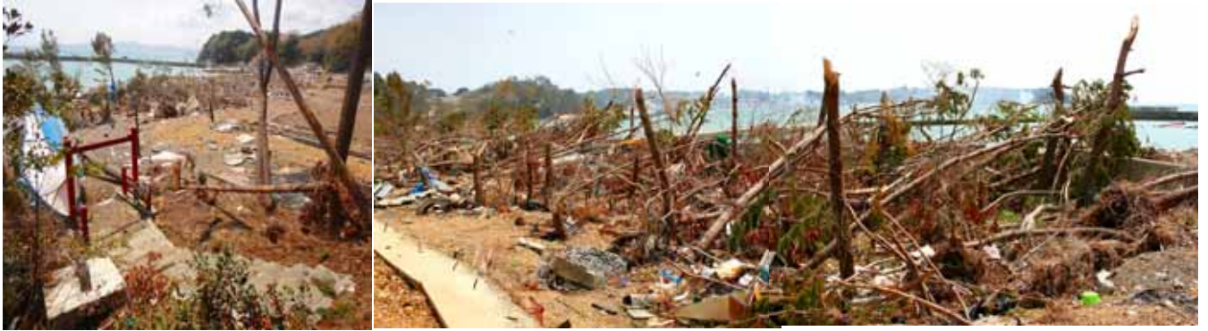
Fig. 21 若いクロマツ海岸林のほとんどが破壊された南三陸町館浜海岸 (宮城県南三陸町館浜)