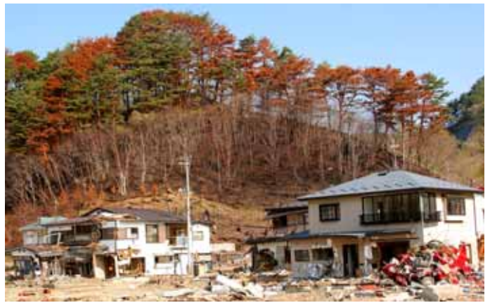
Fig. 47 地震時の火災が裏山のクロマツ樹林へ延焼した例(岩手県宮古市田老地区)