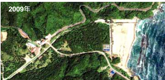
Fig. 17 防潮堤が破壊され、津波は内陸部 800mまで達し、家屋、樹林を破壊した 岩手県宮古市女遊戸