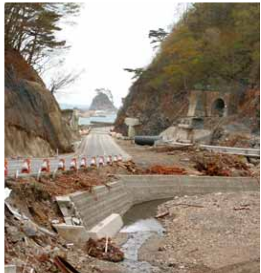
Fig. 33 狭い谷に侵入した津波 (下関伊郡田野畑村明戸)