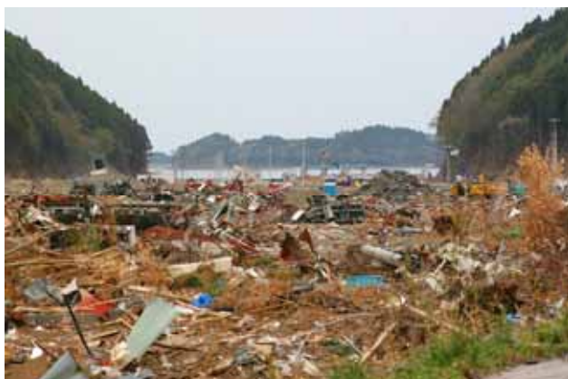
Fig. 29 両側に山地が迫る狭い入り江を襲った津波（宮城県南三陸町戸倉）