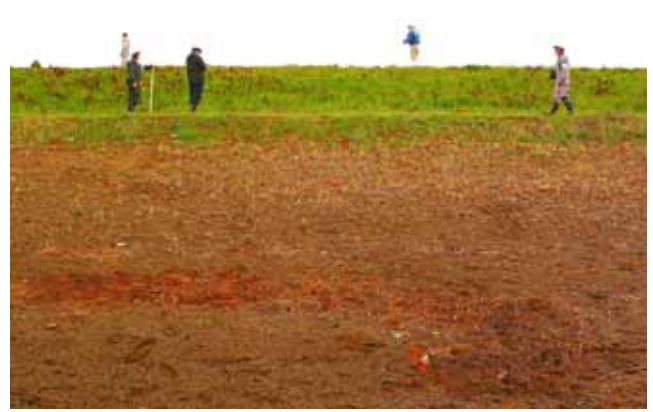
Fig. 49 遡上した津波が堤防を駆け上がった痕跡 5月の時点で草本の芽吹きがほとんどない (宮城県岩沼市阿武隈川左岸)